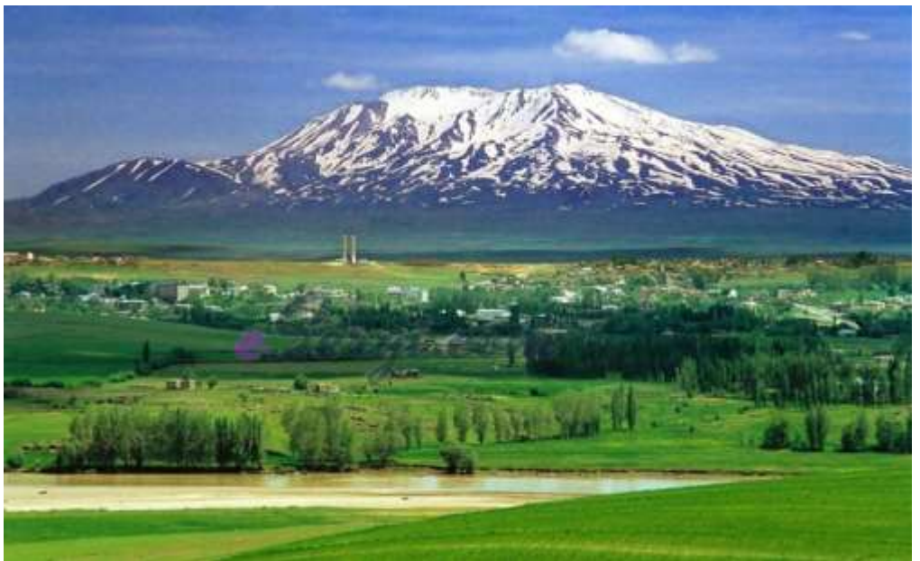
Η πεδιάδα του Μάτζικερτ

ηγετών είχε ελάχιστες άμεσες συνέπειες για την Βυζαντινή ή πιο σωστά Ανατολική Ρωμαϊκή Αυτοκρατορία. Ο Ρ. Διογένης δεχόταν να πληρώνει ένα ορισμένο φόρο προς τον Σουλτάνο και δεν άλλαζαν τα υφιστάμενα σύνορα των δύο κρατών.