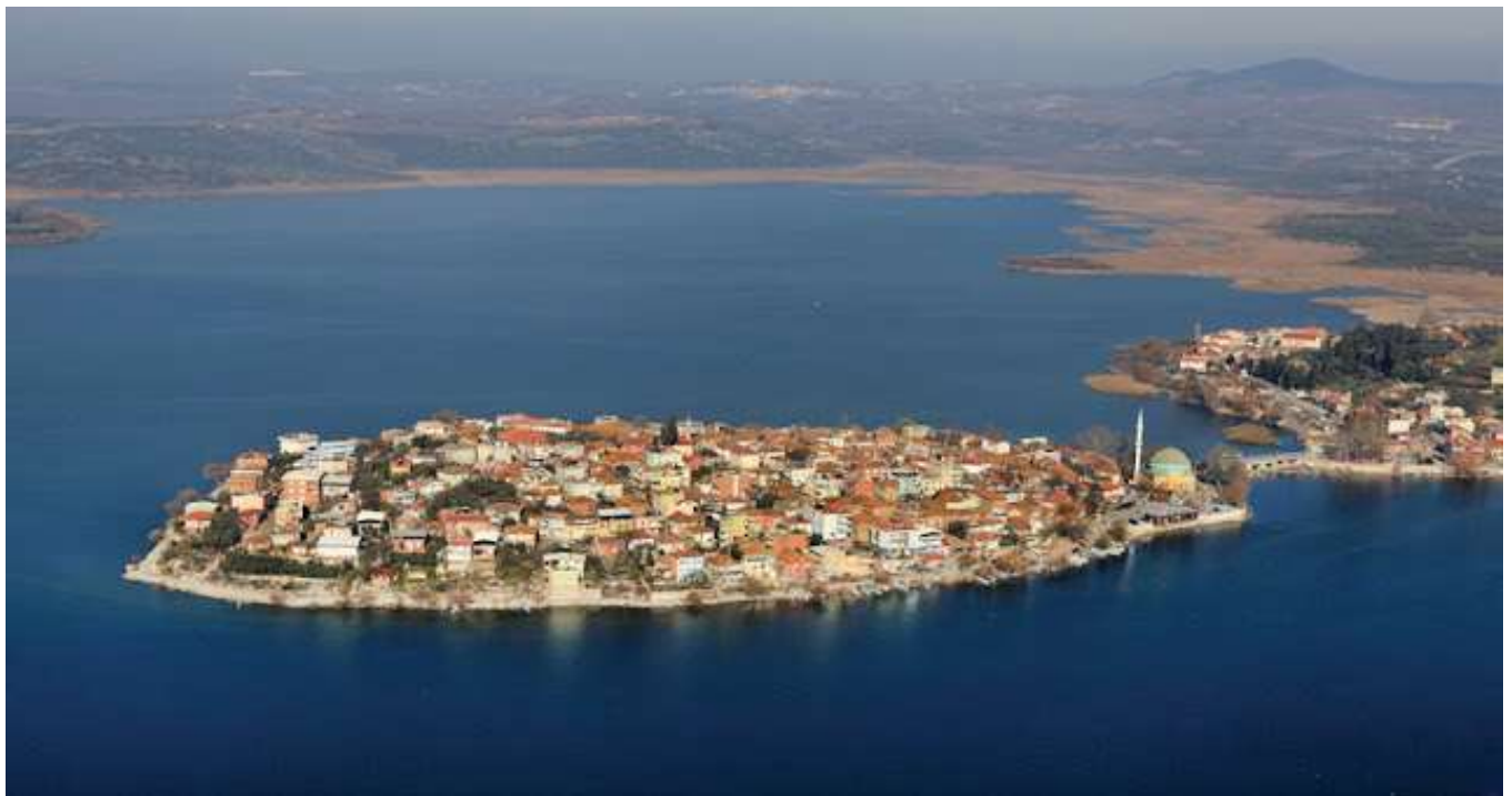
Η νήσος εντός της λίμνης Απολλωνιάδος